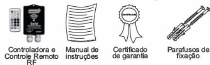
Controladora e Controle Remoto RF